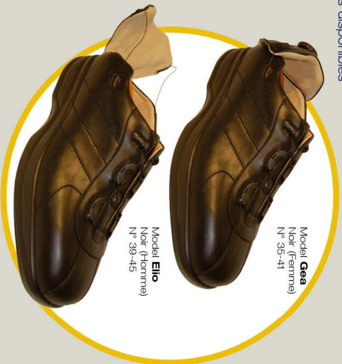
Model Gea Noir (Femme) N° 35-41