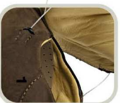
1) L'ouverture postérieure permet de se chauffer avec une seule main