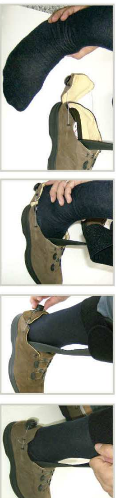
Ce concept permet, le chaussage de n'importe quel pied avec une seule main