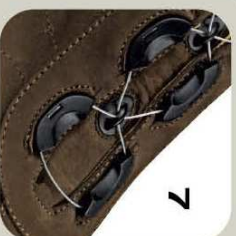
7) Une démultiplication du lacet permet un réglage et une fermeture du chaussage par l'intermédiaire d'un bouton